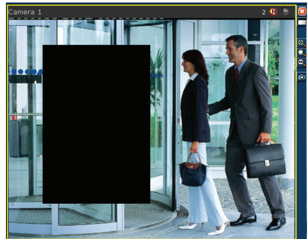
Область, замаскированная с использованием функции конфиденциальных зон Privacy Zones