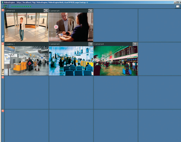
Пример тревожной матрицы с 2 активными тревожными ситуациями