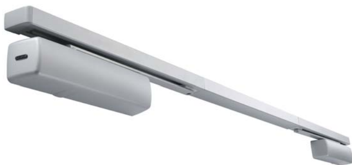
РИС. 3. ► Система марки ABLOY для противопожарных двухстворчатых дверей

В частности, система FD4xx, разработанная компанией ABLOY, работает следующим образом. На стене располагаются магниты, которые удерживают дверь от закрытия в обычное время. Как только срабатывает противопо-