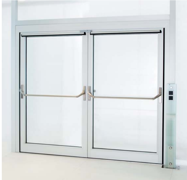
РИС. 4. ◀ Антипаниковое оборудование DORMA PNA 2500

Для аварийных и эвакуационных выходов DORMA предлагает широкий выбор антипаниковых устройств, соответствующих европейским нормам безопасности. Например, системы PNA 2000, PNB 3000 и PNA 2500 (рис. 4), обеспечивающие беспрепятственный выход, рекомендованы к применению в общественных местах, где возможно возникновение паники. Такая