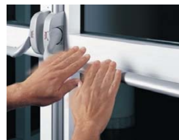
РИС. 5. ◀ Оборудование марки DORMA для эвакуационных и аварийных выходов

Как мы видим, на сегодняшний день на рынке представлен широкий спектр решений для оборудования как аварийных, так и эвакуационных выходов, которые позволяют сберечь жизни людей в условиях чрезвычайной ситуации. При этом вполне реально сохранить свободу перемещения по объекту, защитить себя и свое имущество от людей с нечестными намерениями. Что касается стоимости подобных решений, то по сравнению с сохраненными людскими жизнями она весьма невысока и затраты эти служат благородной цели. ●