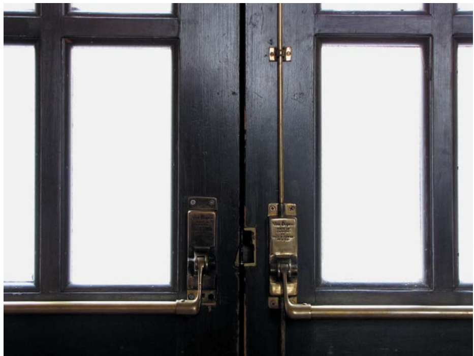
РИС. 1. ▾ Von Duprin: одно из первых антипаниковых устройств

В качестве примера можно привести решение от effeff, которое